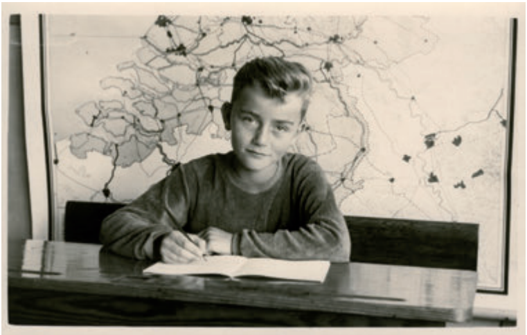
Ik vond leren een nutteloze bezigheid.