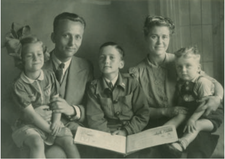
Ons gezin in de nadagen van de Tweede Wereldoorlog. Ik zit, als jongste, op schoot bij mijn moeder.