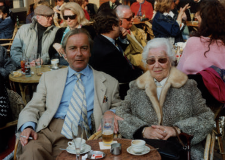
Op het terras met mijn moeder, ze is precies honderd jaar en een dag geworden.