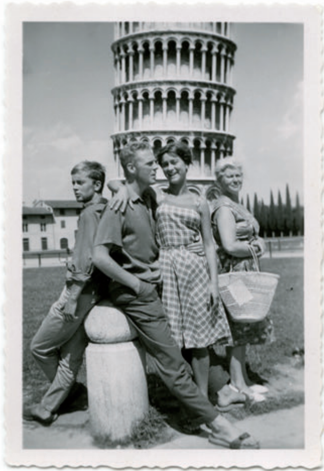
Ik moest met mijn moeder, mijn zus en haar toenmalige vriend mee op 'cultuurvakantie' in Italië. Ik vond het een regelrechte straf.