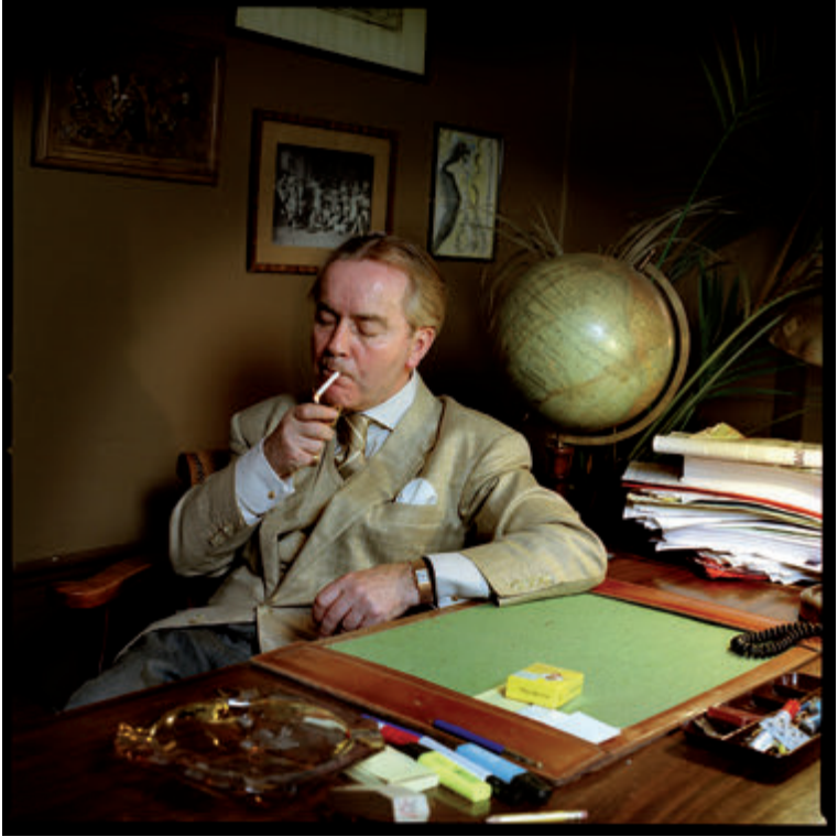
Achter mijn werktafel.