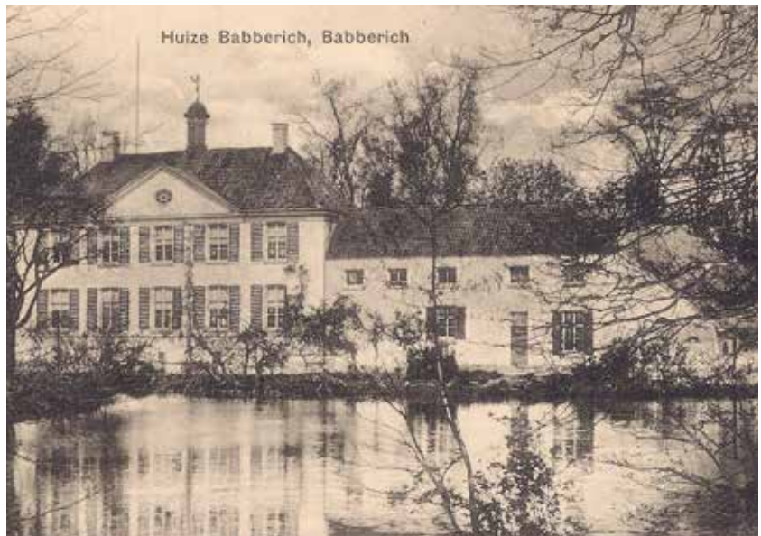
Huize Babberich rond 1900