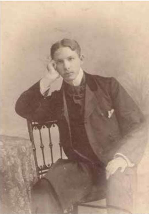
Links: De Nerée voorjaar 1901